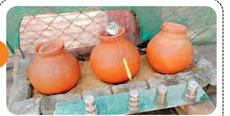
जल दान करने संस्था और समाज के ....