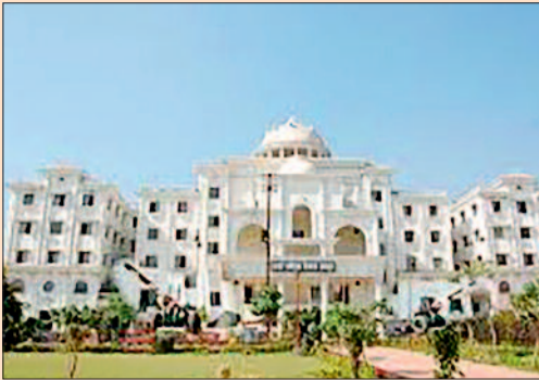
2026-27 के नगर निगम बजट को लेकर सुगबुगाहट